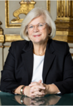
Catherine Vautrin ministre du Travail, de la Santé, des Solidarités et des Familles