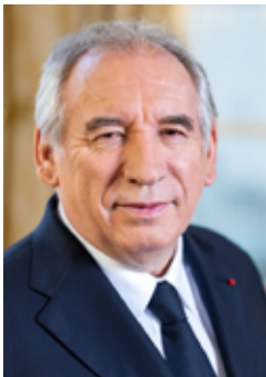
François Bayrou Premier ministre