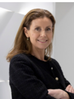
Charlotte Parmentier-Lecoq ministre déléguée chargée de l'Autonomie et du Handicap

Aujourd'hui, nous mesurons le chemin parcouru dans la reconnaissance des droits et l'inclusion, mais aussi celui qu'il nous reste à accomplir. L'inclusion des personnes en situation de handicap doit être une priorité constante, et cela passe par des actions concrètes : renforcer l'accessibilité des lieux publics et des services essentiels, simplifier les démarches administratives, assurer l'école pour tous dans les meilleures conditions et enfin, garantir un accès effectif à l'emploi comme source d'émancipation. L'événement du 11 février 2025 au Handilab est une occasion unique de rassembler les personnes concernées, les acteurs engagés et les représentants des pouvoirs publics pour faire le bilan et tracer les perspectives d'avenir dans un monde où l'innovation technologique repousse les frontières du possible. Ensemble, nous devons poursuivre cet engagement avec ambition et détermination, pour que l'inclusion ne soit plus un combat, mais une évidence dans notre société.